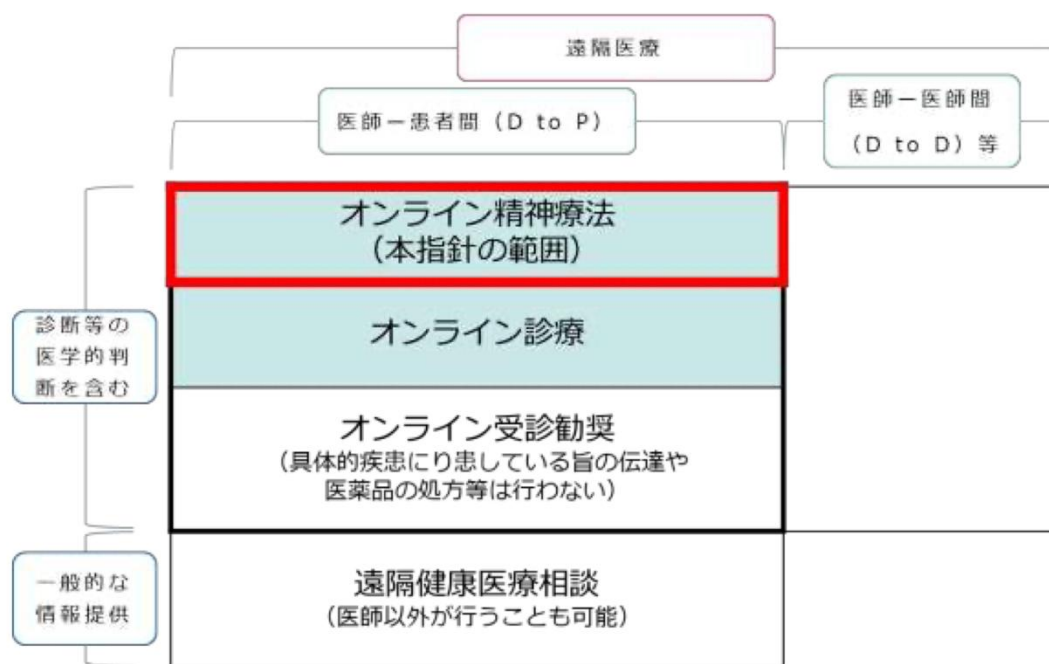
図1：遠隔医療の分類 (参考資料2より引用)