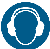
聴覚保護具を着用すること