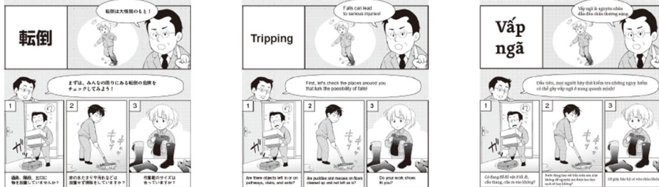
例）転倒防止の注意：14言語対応（画像は、日本語・英語・ベトナム語）

▶動画教材（YouTube）のチャンネル登録はこちらから https://www.youtube.com/user/MHLWanzenvideo/