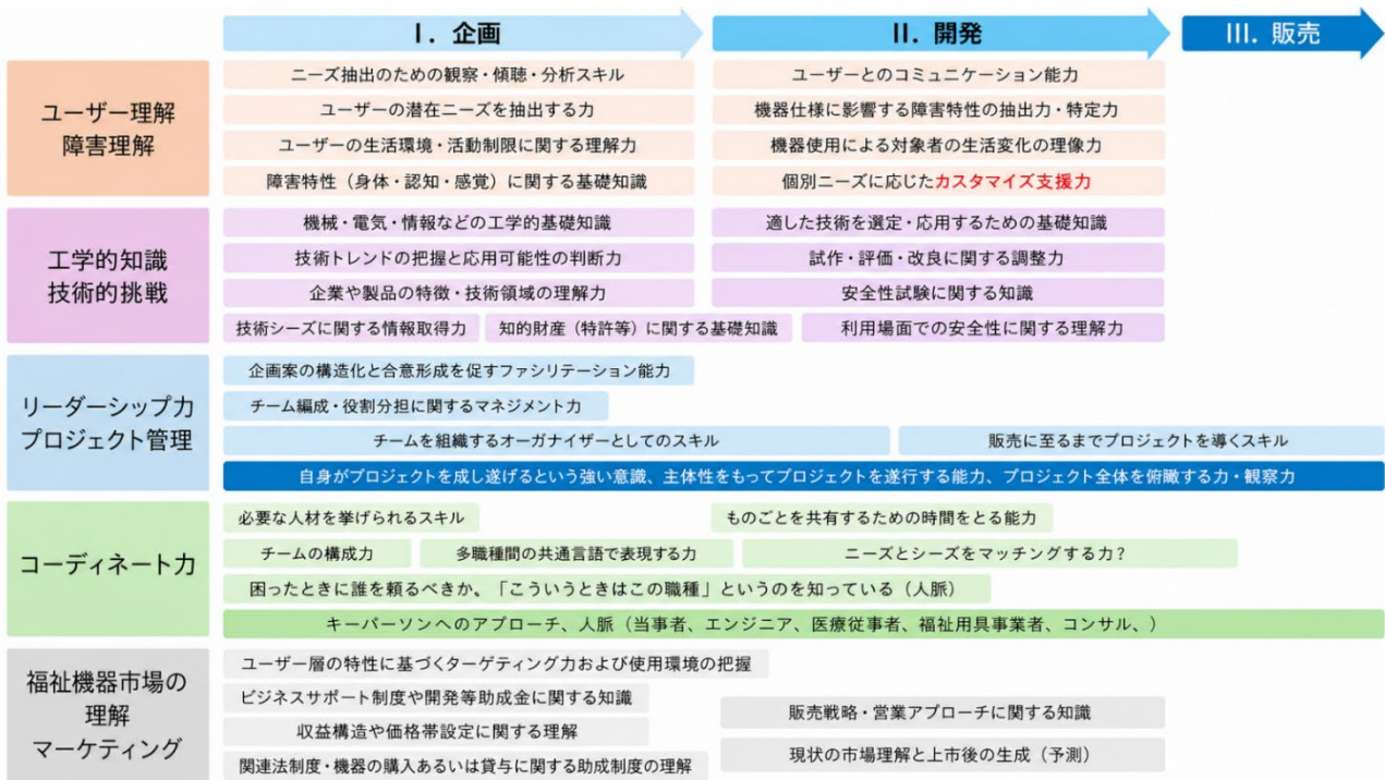
図2 開発フェーズに基づくコーディネーターに必要なスキルマップ（分担報告書より）