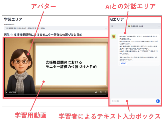
図3 生成 AI を活用した学習コンテンツ外観（分担報告書より）

評価の意味づけについても、評価者の専門領域によって解釈が異なる可能性が示された。これらのことから、評価の再現性向上には、評価基準の精緻化に加え、申請書フォーマットや記載ガイドラインの整備が重要であると考えられる。