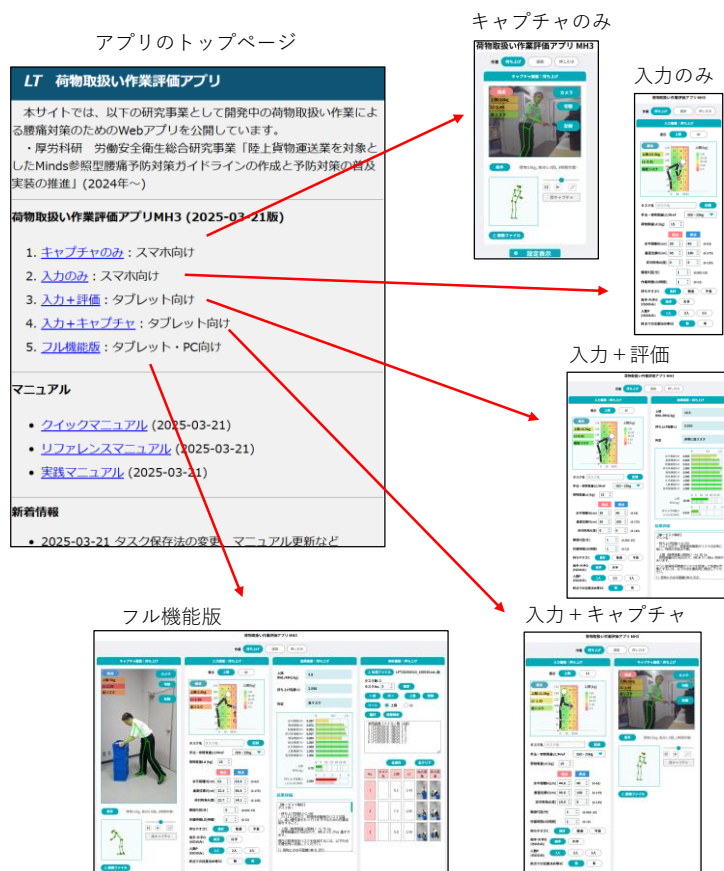
図 2 Web アプリケーションのトップページと各画面の構成

表 2 はリスク評価区分に基づく推定精度を示す。過大評価した条件はセルを赤で、過小評価した条件はセルを青で塗りつぶしている。過大評価した条件は 2 条件のみで、全体的にリスクを過小評価する傾向にあった。また、側面からの撮影が LI の計算値とリスク評価区分が一致する傾向にあった。図 3 は過小評価された水平距離 630 mm、