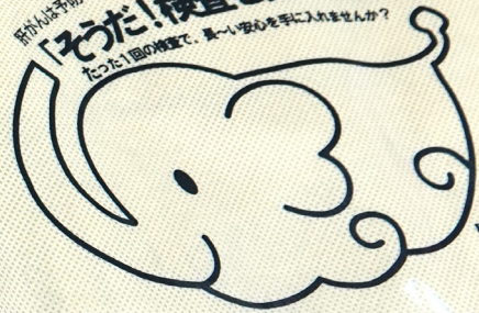
肝炎予防 サポートキャラクター 「かんゾーちゃん」

肝がんは予防できる！肝炎ウイルス 「そうだ！検査を受ける」 たった1回の検査で、長～い安心を手に入れませんか？