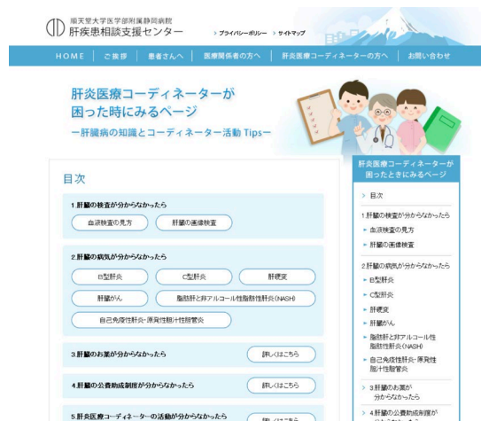
図 3 作成中の肝炎医療 Co 支援 Web ページ

3) 肝炎医療 Co 活動を支援 Web ページ作成 肝炎医療 Co から聞き取りを行い要望が多かった血液検査、疾患、薬剤、行政制度、肝炎医療 Co 活動に関する情報を医師、薬剤師、看護師、事務職員が分担して執筆し、肝炎医療 Co 活動支援のための Web ページとして作成している (図 3)。