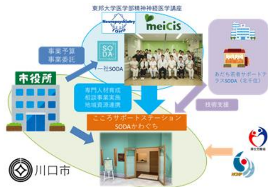
図5 地方自治体主導による若年者早期相談支援サービスのモデル