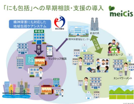
図1 地域特性に応じた早期相談・支援サービスの導入

これまで私たちは、わが国の保健医療福祉体制および地域包括ケアシステムのもとで実施可能な、メンタルヘルスや精神疾患の早期相談・支援の仕組みの提案を目的に、MEICIS（メイシス、Mental health and Early Intervention in the Community-based Integrated care System）と名付けた研究・実践プロジェクトを行ってきた（図1）。