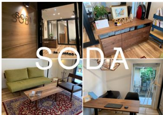
図4 実装したサービスのイメージ（足立区サイト）

人口密集地である東京都において、近年、大学の誘致などにより若年層が増加している足立区を対象エリアに設定した。MEICIS研究プロジェクトとして、2019年7月よりメンタルヘルスのハイリスク群である若年層をターゲットとした相談支援窓口「ワンストップ相談センターSODA」を、民間医療機関（東京足立病院）主導により設置した。この実績に基づき、東京足立病院が足立区の委託を受け、令和4年7月に「あだち若者サポートテラスSODA」として新たに事業を継続した。若年層が軽度のメンタルヘルスの不調を抱えた際や精神疾患を発症早期の段階で適切な支援に結びつくよう地域における『相談の入り口』としての活用を目指し、精神科医、精神保健福