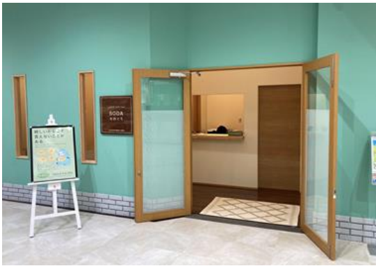
図6 実装したサービスのイメージ（川口市サイト）

都市近郊地域である川口市サイトでは、MEICISの活動を基に設立した「一般社団法人SODA」が、令和4年4月に川口市の「若年者早期相談・支援事業」を受託し、同市保健所の支援を受けて、大規模商業施設イオンモール川口前川の中に「こころサポートステーションSODAかわぐち」を6月に開設した。若者向けの相談サービスは立ち寄りやすくスティグマを払拭したものであることが重要であり、最適な実施環境といえる。開設時から多くのメディアの注目を集め、テレビ放映されたり新聞記事が掲載されたりした。