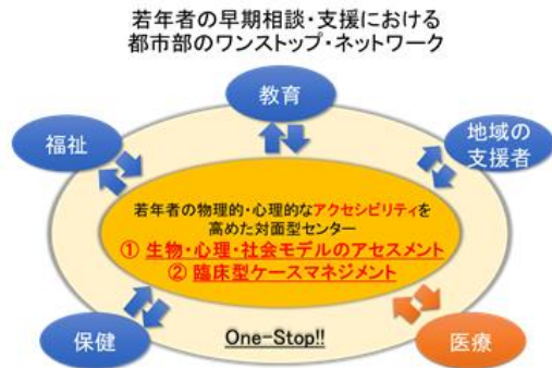
図3 民間医療機関主導による若年者早期相談支援サービスのモデル