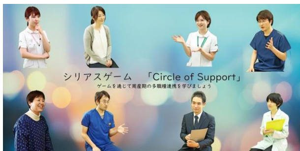
図2 シリアスゲーム「Circle of Support」