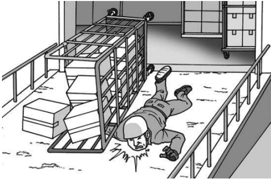
図 1 ロールボックスパレット（転倒災害例 75 から）

死亡災害を含む労働災害の原因となる荷役用具として、ロールボックスパレット 76 （1例として、図1）がある 77 。