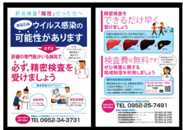
図2：患者説明用のパンフレット

研究方法美川眼科医院において、術前検査時に肝炎ウイルスに関する血液学的検査を行った患者を対象に、陽性者については肝臓専門医の受診勧奨を行い、陰性者については陰性結果の告知を行った（図1）。B型肝炎及びC型肝炎の陽性率を調べ、その中で今回の検査で初めて発見された患者の割合を調べた。また、受診勧奨を行った時に、佐賀大学医学部肝疾患センターが作成した説明用のパンフレットを用いて説明し（図2）、そのアウトカム