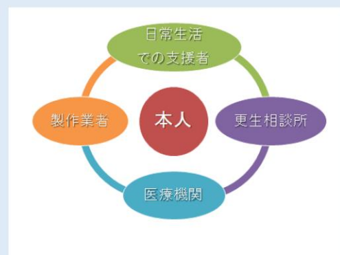
図2 フォローアップの方策

実態調査の分析をもとに、利用者の意見や要望についての調査を追加して実施し、具体的で効果的なフォローアップ方法を提案する。利用者本人を含めた多くの機関が重層的に関わっていく体制（図2）が現実的と考えるが、各地域の現状に応じた方策を選択していくことになる。適切な補装具を継続的・有効的に利用できるシステムが全国レベルで展開していくことが期待される。