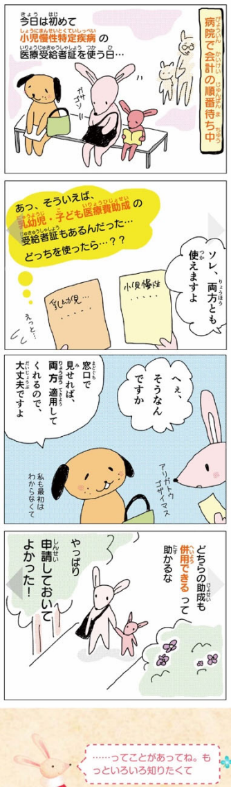
図 1. 4コマ漫画 (冒頭)