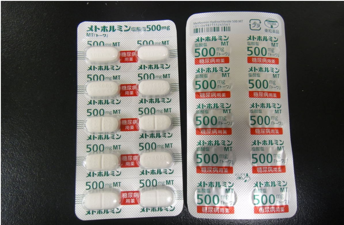
Figure.3 日本市販品 (メトホルミン塩酸塩錠 500 mgMT 「トロー」)