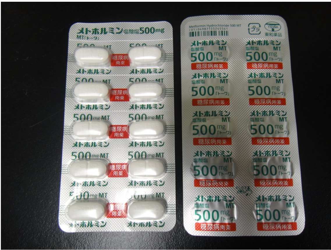
Figure.1 PTP シートのみで届いた製品：PTP シートタイプ (32-500-A7-SG-50)