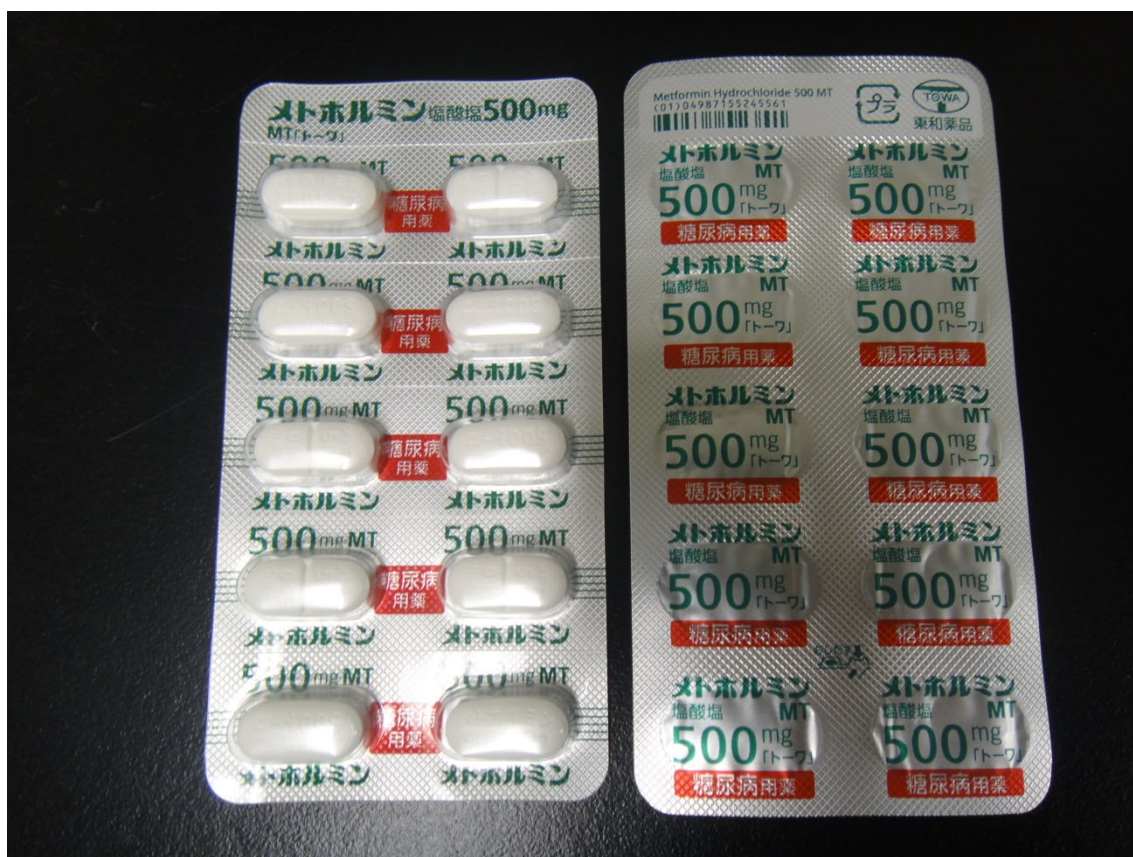
Figure.1 PTP シートのみで届いた製品：PTP シートタイプ (32-500-A7-SG-50)