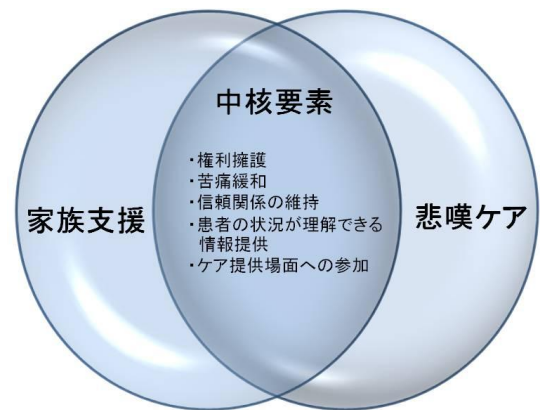
こころのケア中核要素