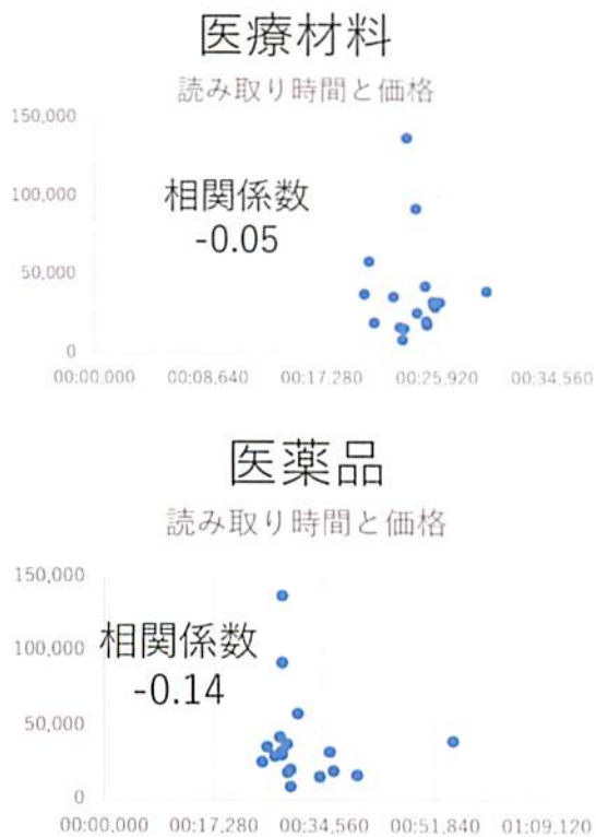
図1 バーコード読取り時間とリーダーの価格の相関

医薬品と医療機器で、それぞれ同じバーコードリーダーを使用して評価をおこなったが、使いやすいバーコードリーダーは、医薬品と医療機器で異なることが明らかになった。