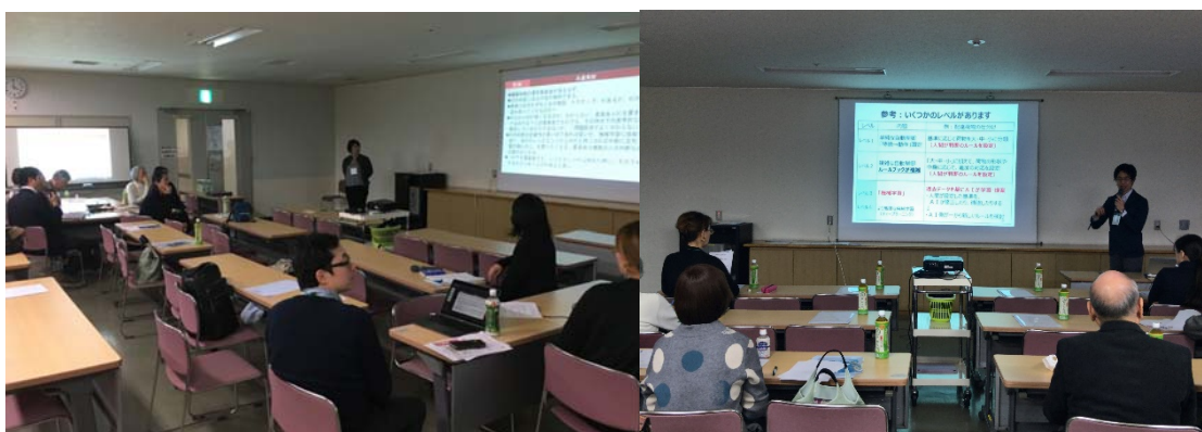
検討行事の様様（左：事例の紹介、右：冒頭の講義）

同じく2020年2月には東京都内で開催する予定であったが、新型コロナウイルス感染症の感染拡大防止のためオンラインで開催した（COMLの会員など・参加者14名）。