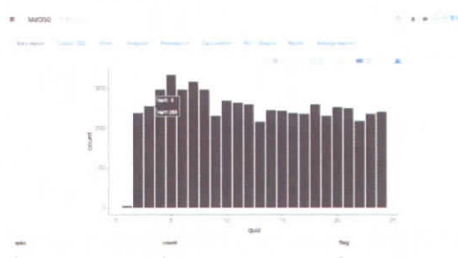
図4 サンプルグラフの表示例