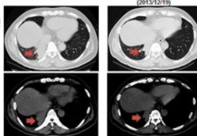
YM155+Erlotinib 2サイクル後 (2013/12/15)