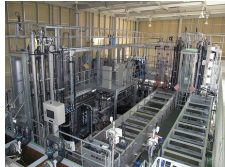
図1 次世代型浄水処理パイロットプラント

生成した上、適合度の高い確率密度関数をあてはめた。モンテカルロシミュレーションにより10万回の繰り返し計算を行い、非加熱水道水の飲用による C. jejuni の一日当たり摂取量を算出した。 C. jejuni の用量 - 反応モデル ( P_d = 1 - e^{-0.686 \times D} , D: 用量) より一日感染確率ならびに年間感染確率を推定した。