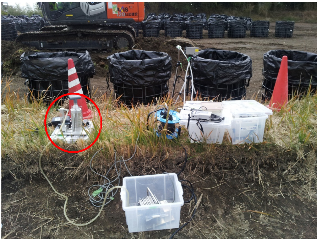
写真2 定点における粉じん計測（赤丸はアンダーセンサンプラー）