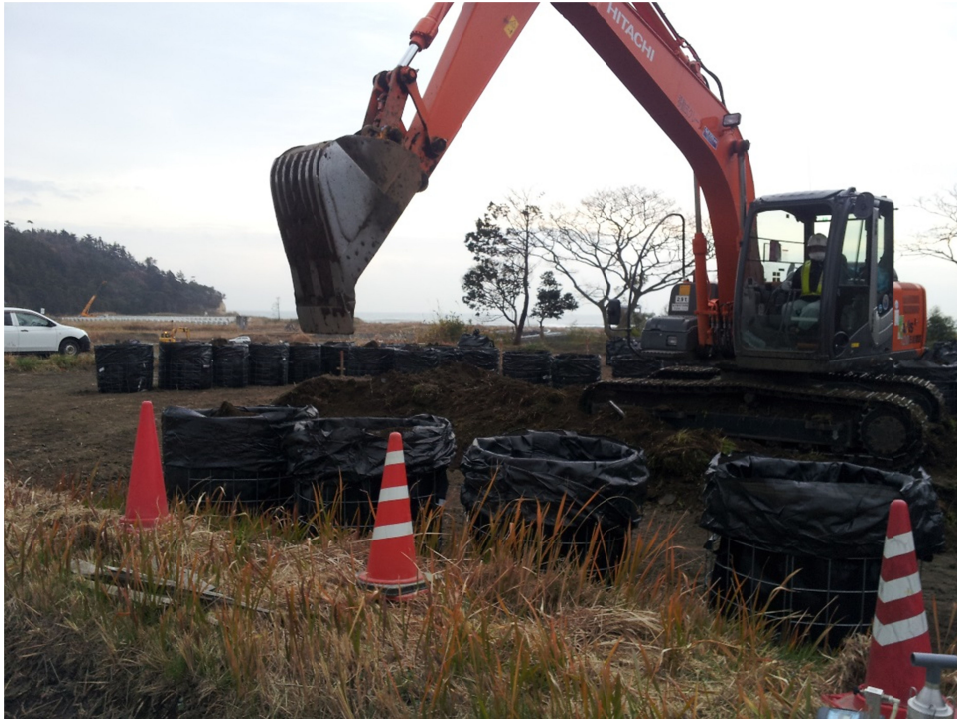
写真1 重機によって汚染土壌がフレコンバックに回収される