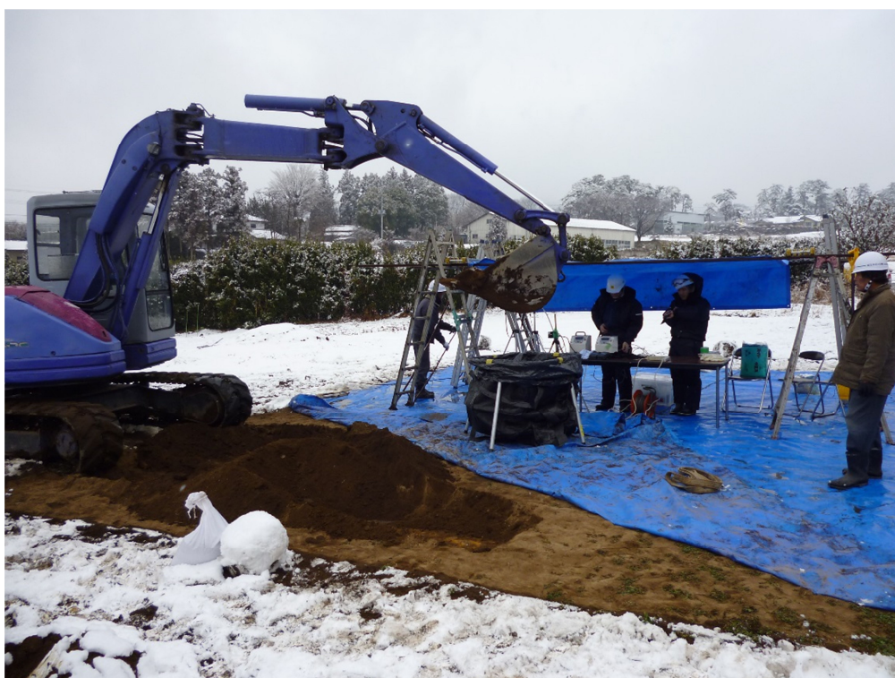
写真6 耕作地における模擬的な除染作業風景