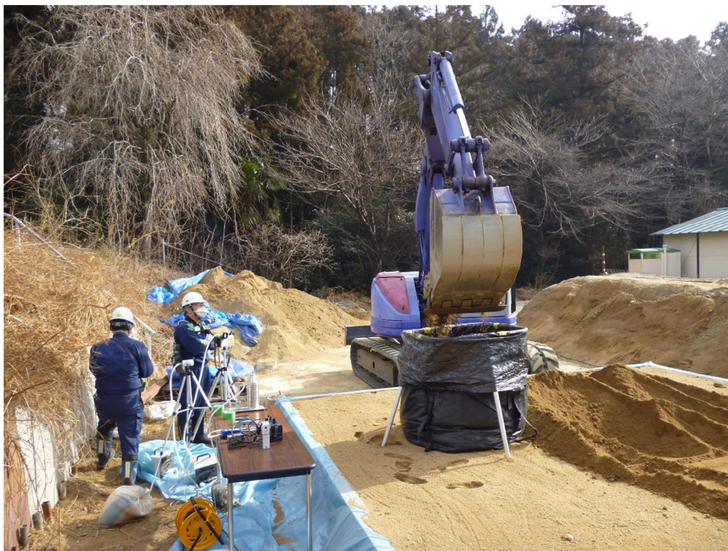
写真5 山砂を用いた模擬的な除染作業風景