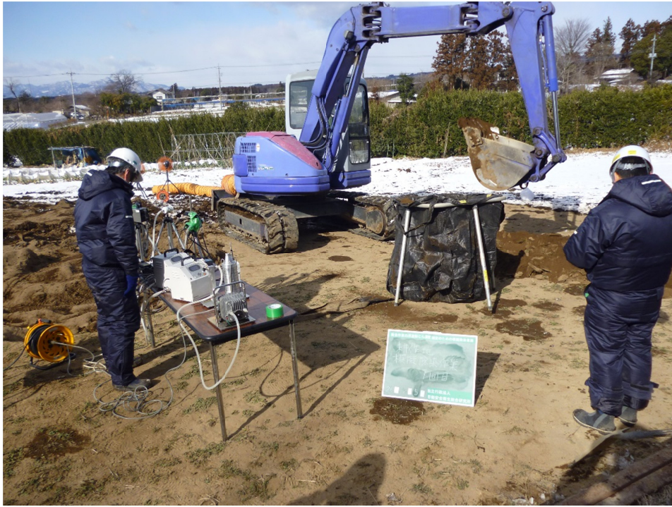
写真7 水田における模擬的な除染作業風景