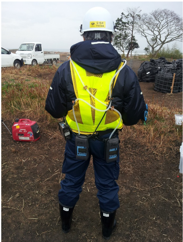
写真 3・4 個人ばく露測定の装備