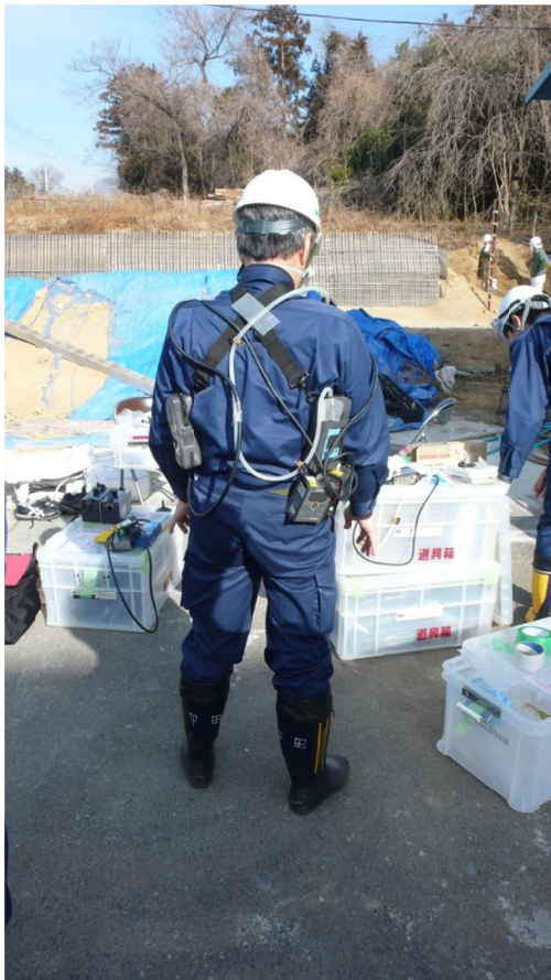
写真8 個人ばく露測定の装備