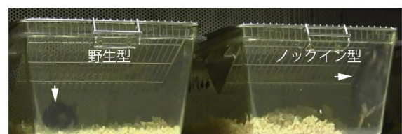
図2. Cadm1 変異ノックインマウスの常同性行動

マウスの神経組織、生理学および行動解析における解析を行った。行動解析では、Cadm1ノックアウトマウスで見られなかった常動性の行動が現れた。これらのことから、Loss-of-functionのみ