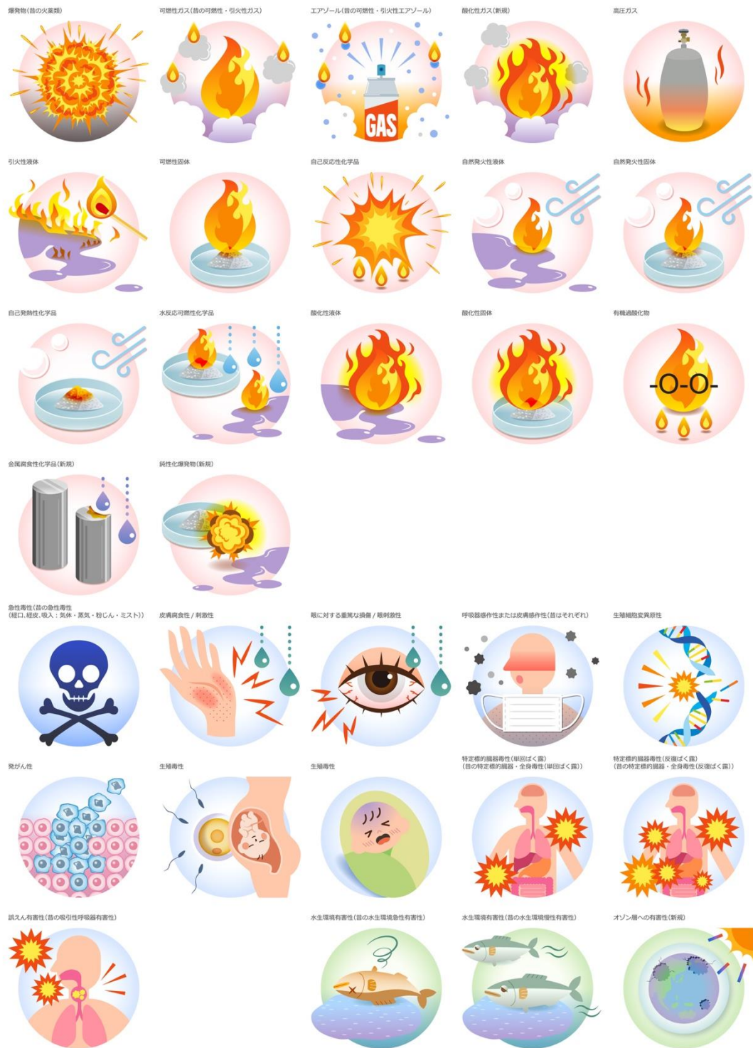
図2 GHS 分類に対するイラスト化