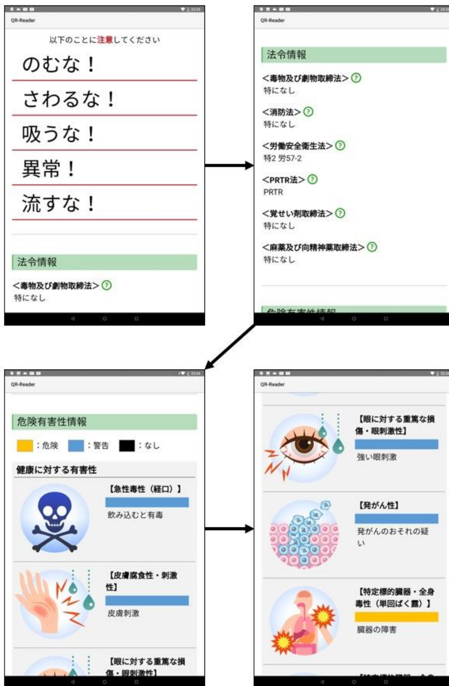
図2 アプリケーション(ベータ版)の画面遷移例