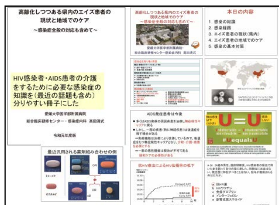
図 1 講演内容（一部抜粋）介護に必要な HIV の知識を講演した。

県内の高齢者施設から現場の介護・福祉担当者に参加してもらい、HIV 感染症等に関する研修会を令和 2 年 1 月 29 日に開催した。研修会時に HIV 感染者の福祉・介護についてアンケートを行い（参加者 53 名、図 1、2、3）、次回の諸資料の参考にすることとした。また、参加者には分担研究 4 にての成果物である、感染予防内服薬を配備している病院名など具体的に刷り入れた HIV に関するポケット冊子（18 x 10 cm 程度）を配布した。