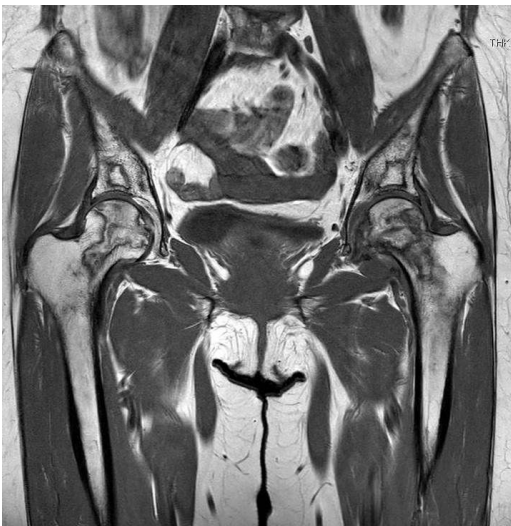
図 3. 股関節単純 MRI T1 強調像