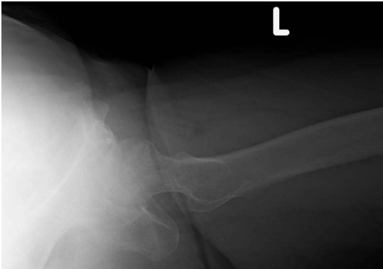
図 2. 両股関節単純 X 線ラウエンスタイン像