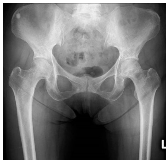
図 1. 股関節正面単純 X 線像

単純レントゲンでは右 Stage 2、左 Stage 3A、MRI では両側とも T1WI で骨頭に帯状低信号域を認め、両側とも Type C1 と判定した(図 1-3)。また両寛骨臼側にも骨頭側と同様に T1WI で高信号域を取り巻く低信号域を認めた(図 3)。両膝関節には MRI で明らかな異常信号域は認めなかった。