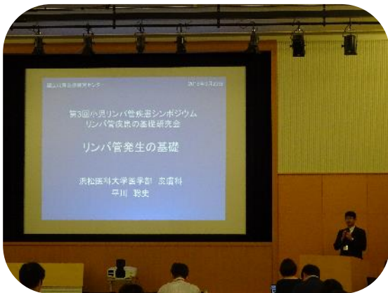
各講師による発表に加え、