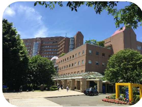
国立成育医療研究センターにて開催いたしました。