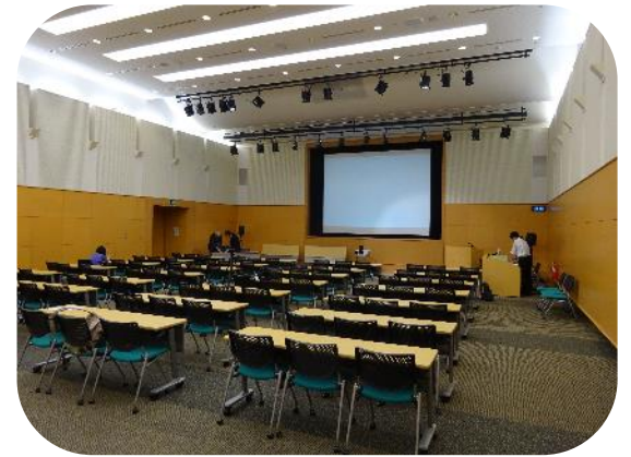
約80席ほどお席を用意させていただきましたが