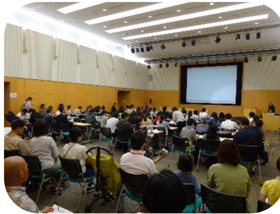
100人を超える方にお越しいただきました。