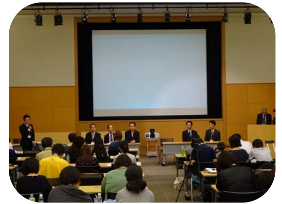
活発な質疑応答も行われました。