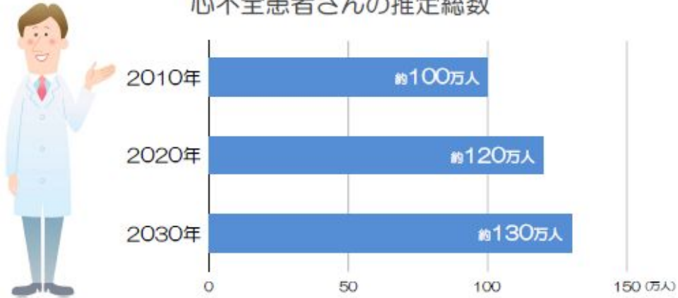
心不全患者さんの推定総数