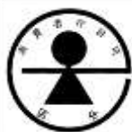
(b) 特別用途食品の標識

504 以上述べた「(ba) 特別用途食品」と「(cb) 特定保健用食品」との規制上の関係を図示す 505 ると次表のとおりとなる。