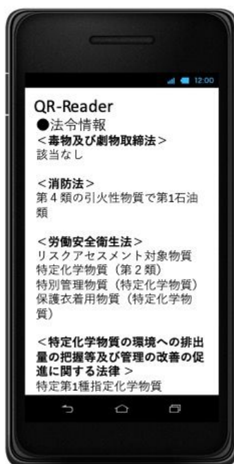
結果表示画面 (例：ベンゼン)