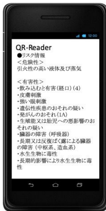
結果表示画面 (例：ベンゼン)