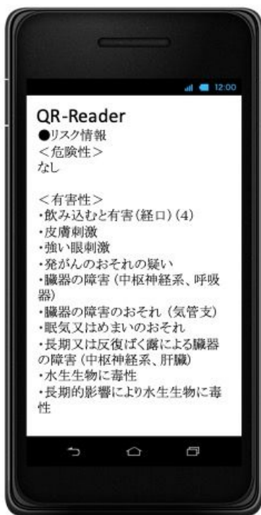
結果表示画面 (例：ジクロロメタン)