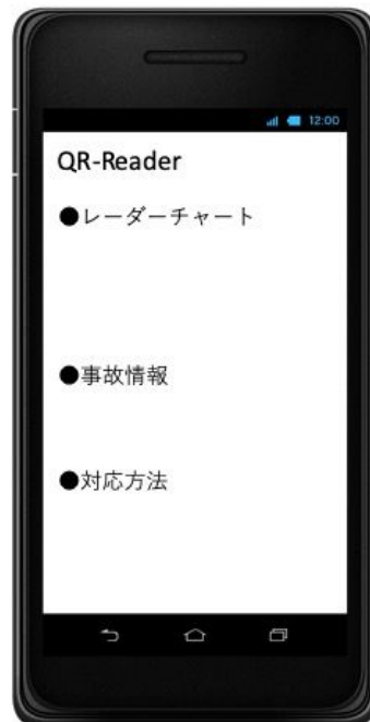
結果表示画面 (可能機能)