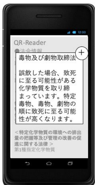
結果表示画面 (法令名をクリック)