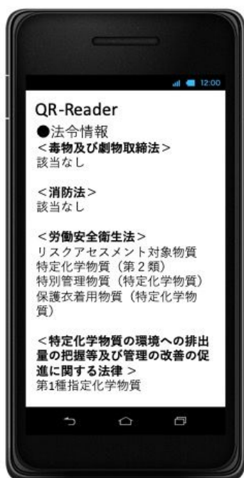
結果表示画面 (例：ジクロロメタン)