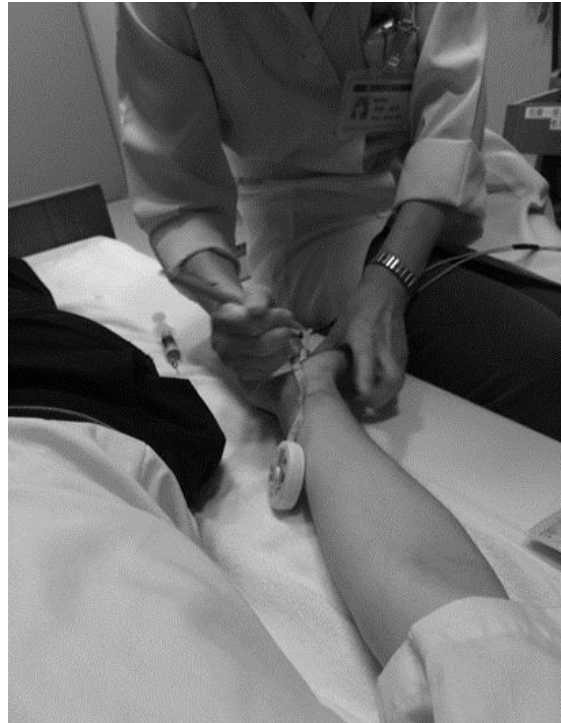
実際の神経伝導速度検査