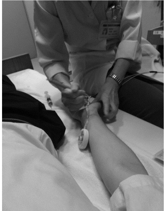
実際の神経伝導速度検査