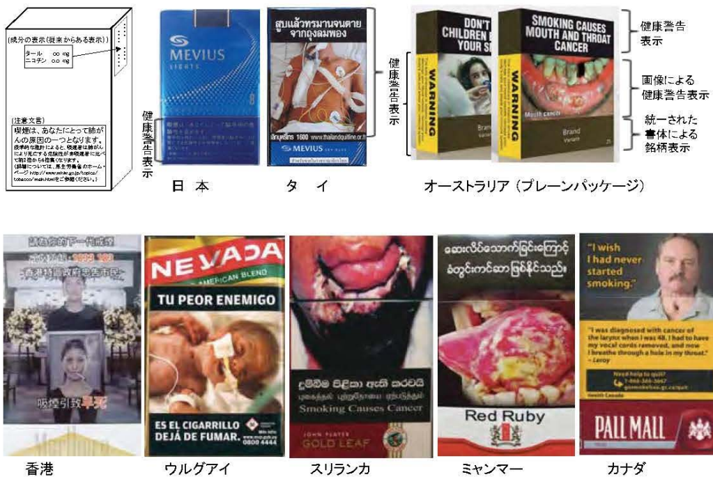
図2 日本と各国の画像付き健康警告表示入りのパッケージ例