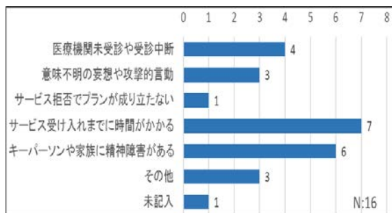
図2 精神障害者支援で困難と感じていること