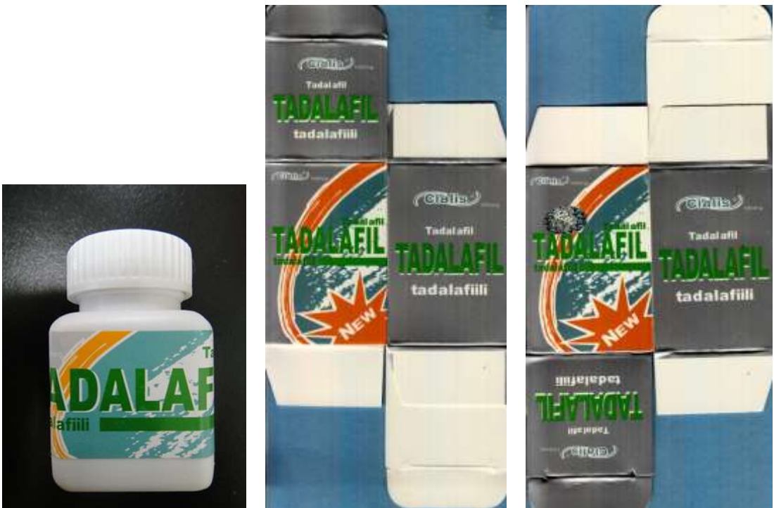
図 7-3. ボトルタイプ 1 のシアリス (22-100-C1-CN-30 : 模造品 (未承認規格))