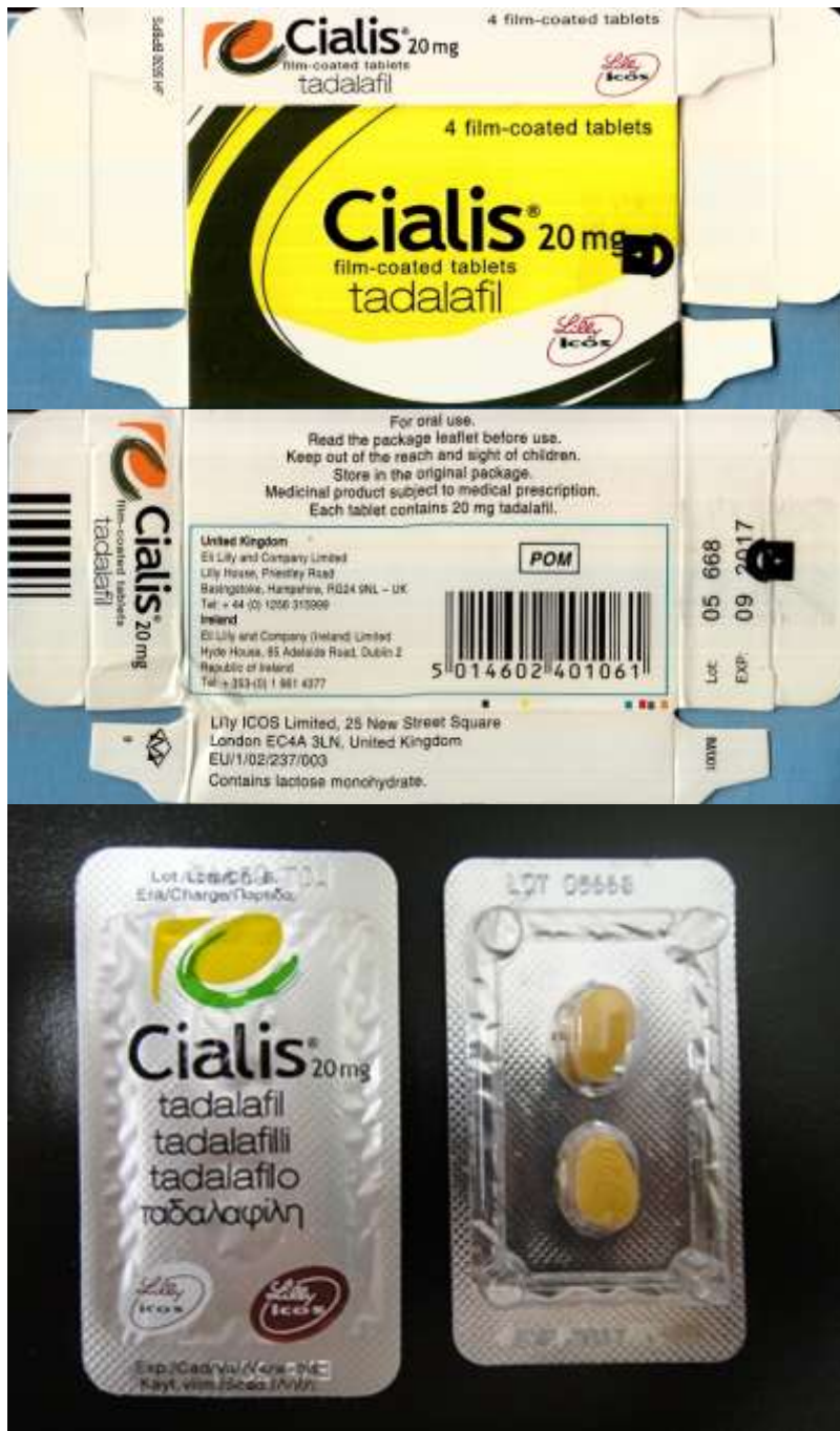
図 5-4. ボックスタイプの製品:ボックスタイプ 4 (17-20-B4-CN-8-5 : 模造品)