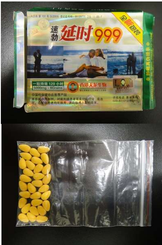
图 3. バラで届いた製品 (14-20-D1-CN-30 : 真正性不明)