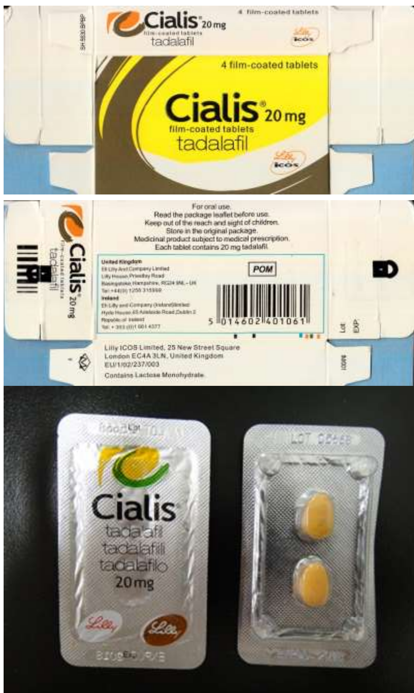
図 5-3. ボックスタイプの製品:ボックスタイプ 3 (17-20-B3-CN-8-4 : 模造品)