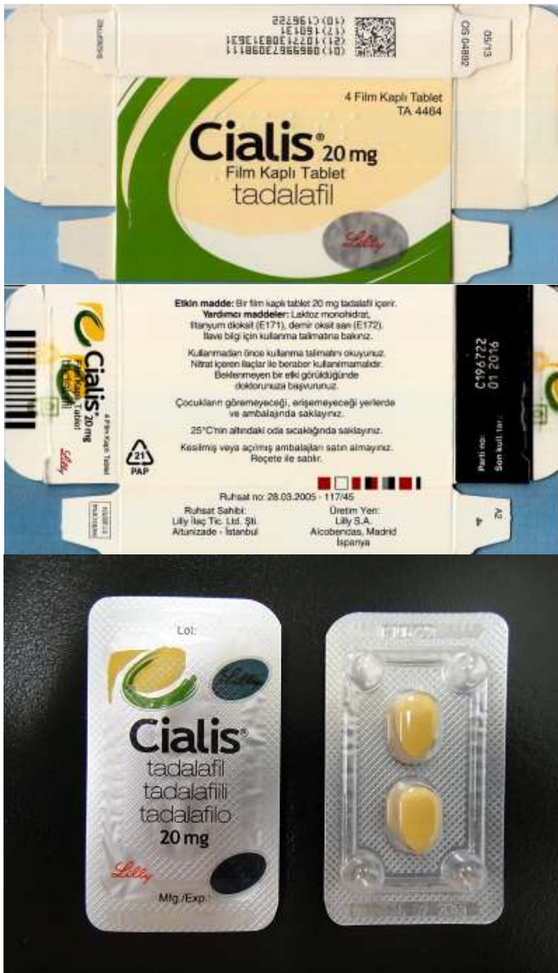
図 5-2. ボックスタイプの製品：ボックスタイプ 2 (11-20-B2-SG-28 : 真正品)