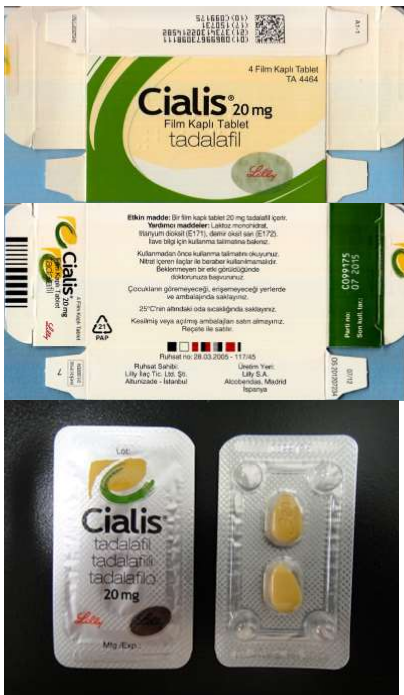
図 5-1. ボックスタイプの製品：ボックスタイプ 1 (06-20-B1-SG-32 : 真正品)