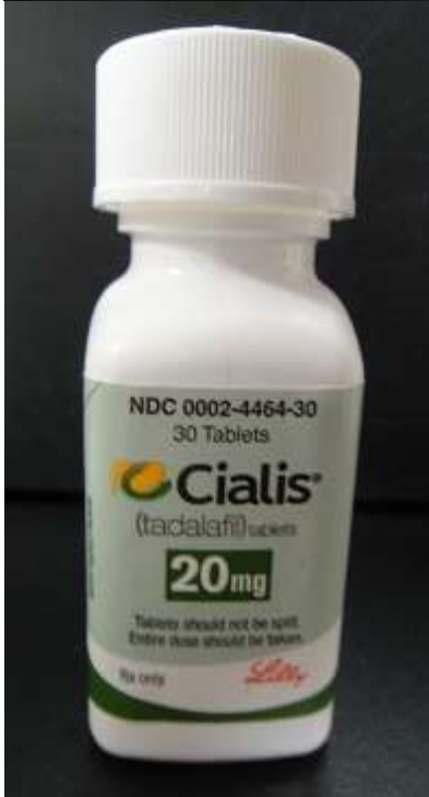
図 7-1. ボトルタイプ 1 のシアリス (11-20-C1-USA-30 : 真正品)