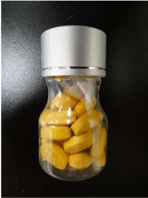
図 8-3. ボトルタイプ 2 のシアリス (24-100-C2-CN-30 : 模造品 (未承認規格))