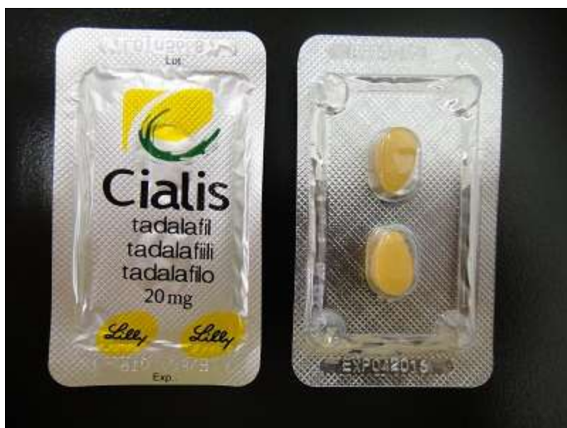
図 4-2. PTP シートのみで届いた製品：PTP シートタイプ 2 (04-20-A2-HK-36：模造品)