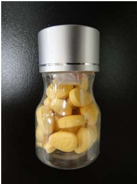
図 8-2. ボトルタイプ 2 のシアリス (24-50-C2-CN-30 : 模造品 (未承認規格))