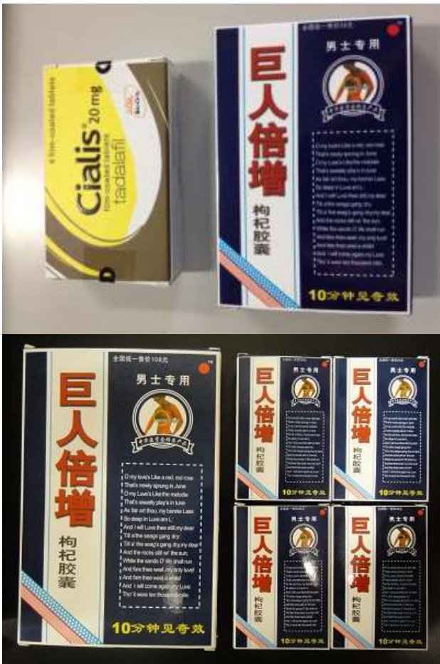
図 6. 異なる製品の箱に入っていたボックスタイプのシアリス (17-20-B3-CN-8-4 : 模造品)