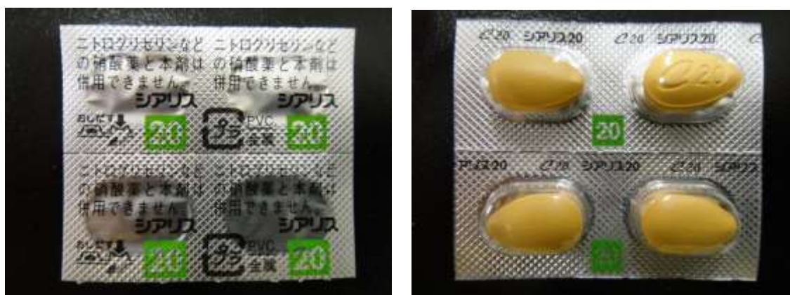
図 4-1. PTP シートのみで届いた製品：PTP シートタイプ 1 (25-20-A1-SG-4：真正性不明)