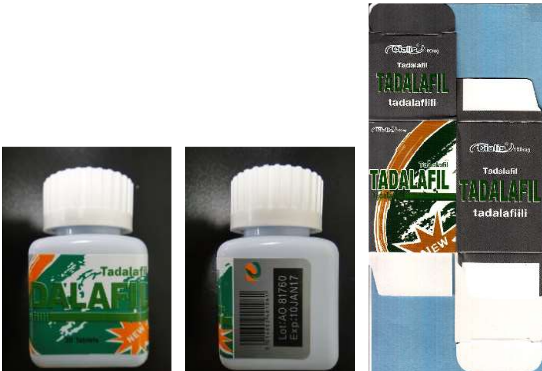
図 7-2. ボトルタイプ 1 のシアリス (20-100-C1-JPN-30 : 模造品 (未承認規格))