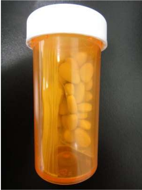
図 8-1. ボトルタイプ 2 のシアリス (19-20-C2-USA-30 : 真正性不明)