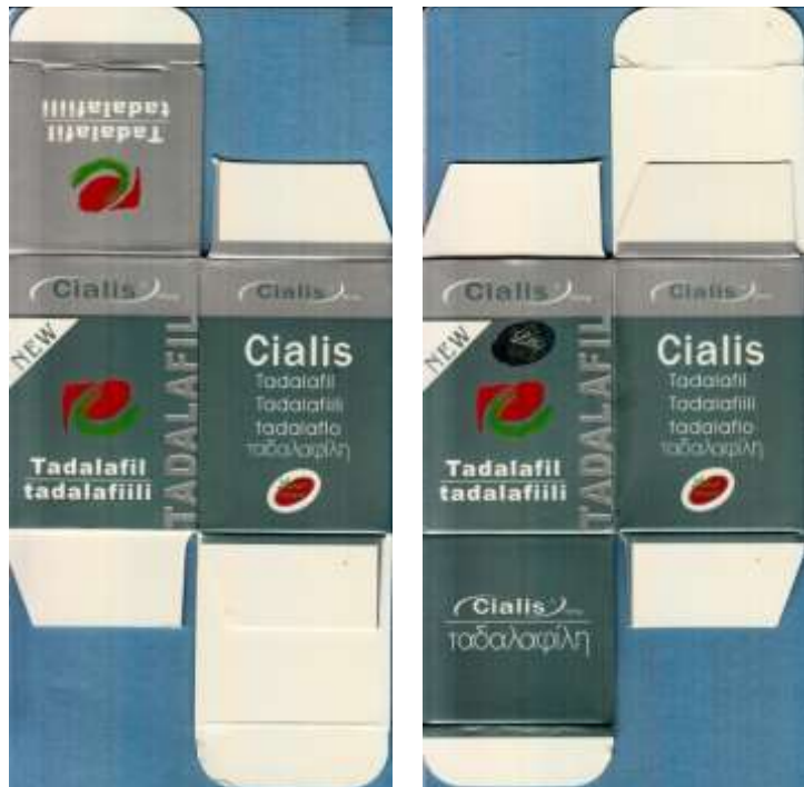
図 7-4. ボトルタイプ 1 のシアリス (22-50-C1-CN-30 : 模造品 (未承認規格))