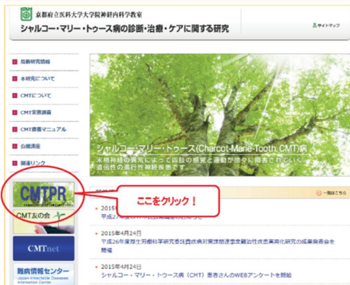
図 1 . CMTPR の登録手順 .