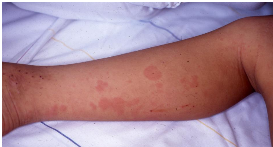
図1: ASD にみられる皮疹

急性期に出現し、発熱時にサーモンピンクに潮紅する。周囲の健常皮膚を擦過すると、同じ皮疹が擦過部位に出現する(ケブネル現象)。