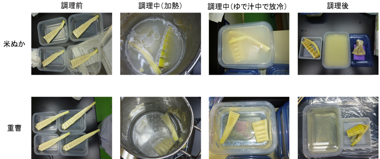
図2：タケノコのおく抜きの様子