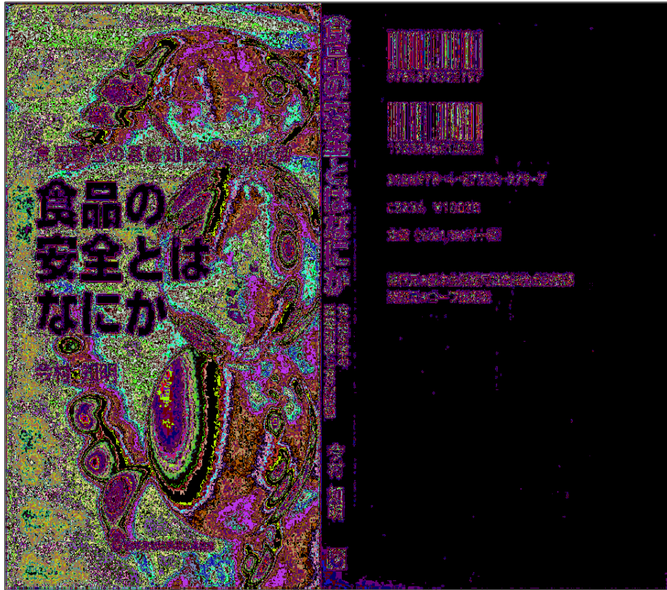
【書籍「食品の安全とはなにか - 食品安全の基礎知識と食品防御」第2版】