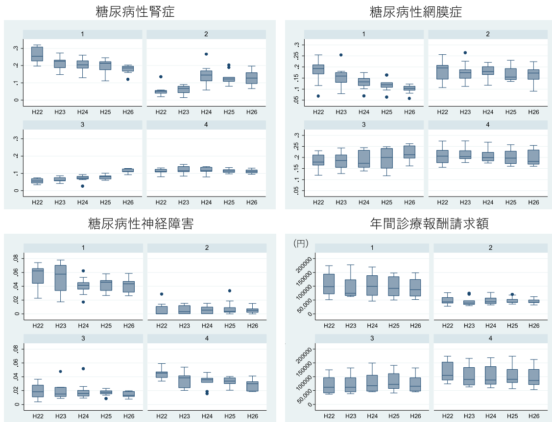
図3. グループ別糖尿病トリオパシーと診療報酬請求額の経年変化