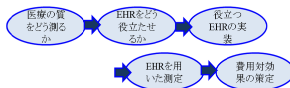
図5 EHRを用いた医療の質の測定

米国MU政策は単にEHR導入がcost-effectiveかという議論ではなく、国家主導で医療の質の向上のためにEHRの果たすべき役割を定め、それを実現したとき、どの程度、どのように質の向上に役立つかを評価するというプロセスである(図4)。このためには医療の質をどう捉えるかの枠組みの策定が必要である。