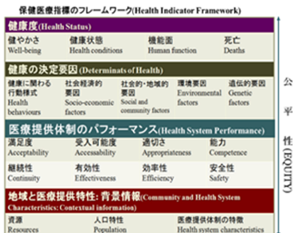
図2 Health Indicator Framework(ISO ISO/TS 21667:2004)の概要

を記述することを目的に、多様な医療提供体制を網羅できる概念的な、高次のフレームワークとなっている。図2はその概要を要約し、健康のアウトカム、医療提供体制のパフォーマンス、地域的・国家的多様性に関わる要因を網羅する。本研究ではこのうち