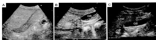
図5 腹部超音波所見(症例2) A. 3週、胆嚢内に胆泥が充満している。 B. 11週、胆嚢内に echo free space が出現した。 C. 15週、胆泥は完全に消失した。 GB: gall bladder

一度も正常化したことはなかった。9週に輸血を施行し、一時異常高値となったが急速に改善し、肝機能の改善と同時に正常化した。