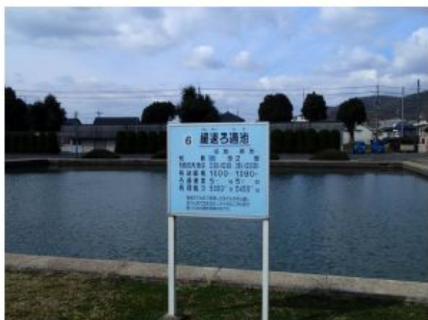
明治 38 年からの緩速ろ過池