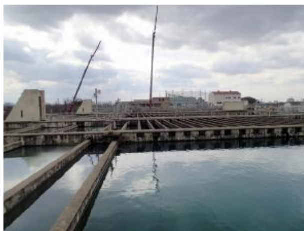
傾斜板の無い沈澱池と有る沈澱池（奥）