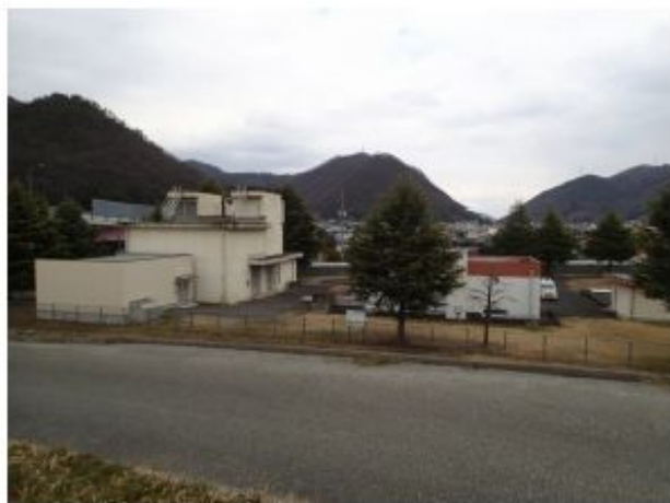
紫外線処理棟（左手前）堤防部から撮影