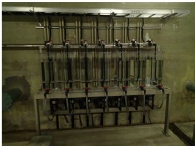
自動浄水採水装置（クリプト対策指針） 20L×14日分