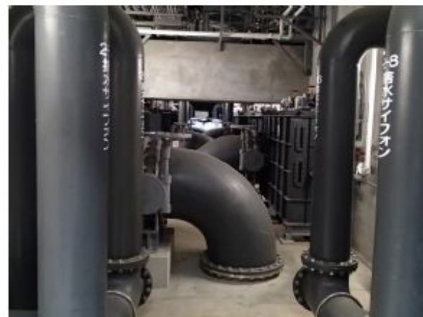
1,2号ろ過池：濁度低減対策（捨水、スローダウン、スロースタートに改造されたろ過池管廊）