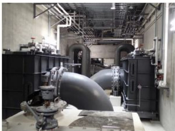
1,2号ろ過池：スローダウンのための連通装置（エアアームを利用して徐々に水頭を下げる）