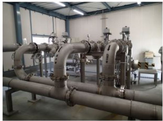
紫外線処理装置全体（反対側から撮影）