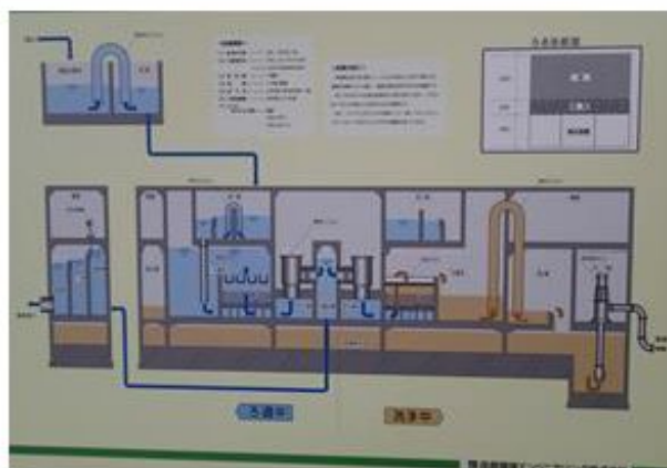
3号ろ過池濁度低減対策説明図