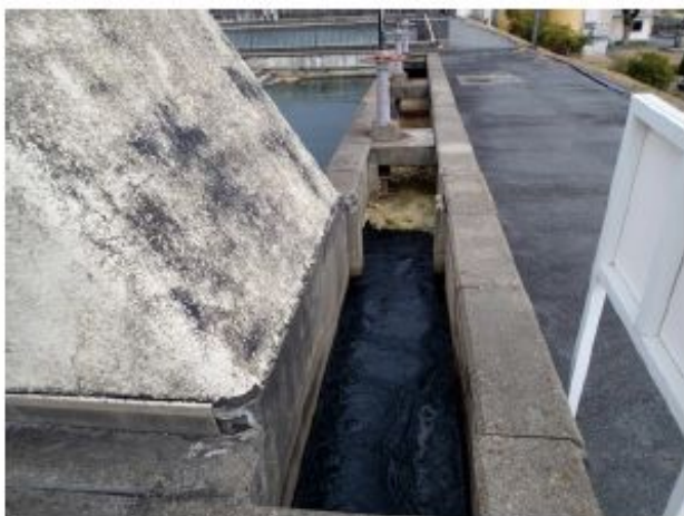
ブロック形成池流入部