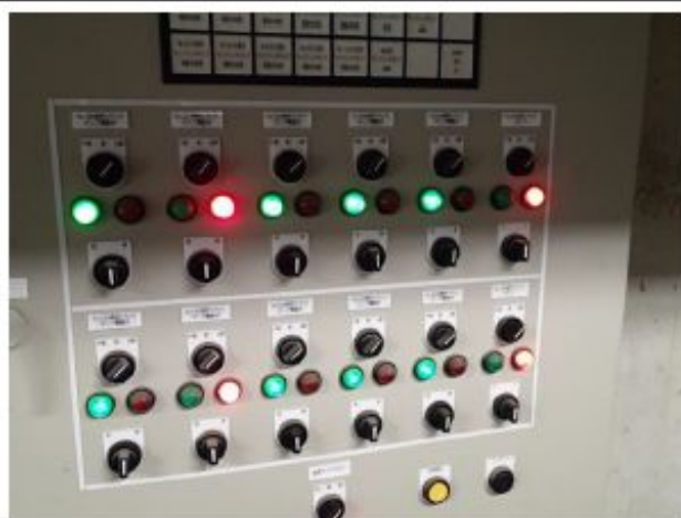
濁度計測の系統切り替え可能な操作盤