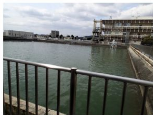
普通沈澱池（スラッジ除去は数年に 1 回か？）