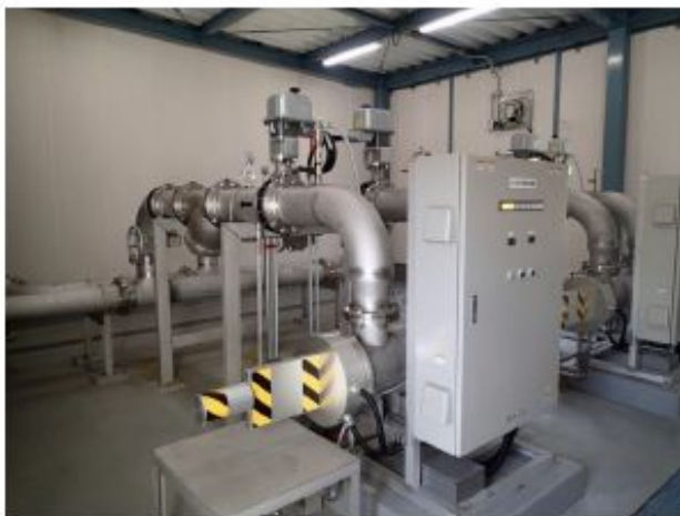
紫外線処理装置全体（2系統）