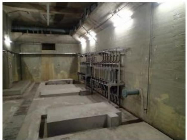
自動浄水採水装置（クリプト対策指針） 設置状況