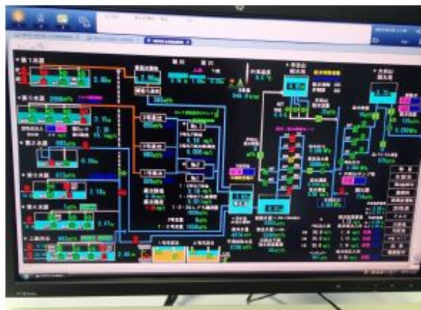
処理フロー（多種多様であり複雑）