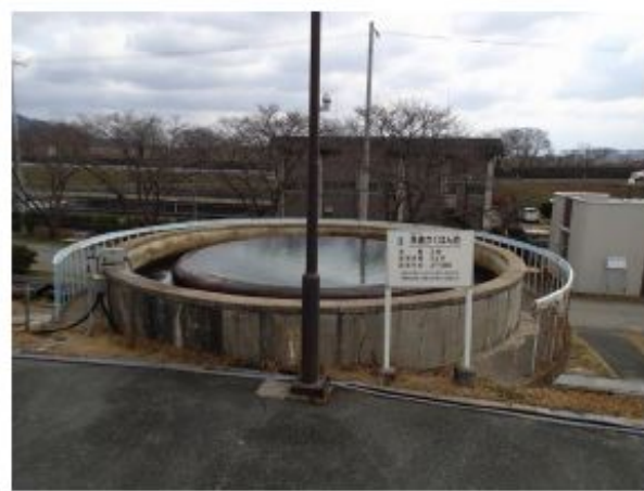
急速混和池（下部にろ過池洗浄排水を排水池なしで直接流入させる。）構造的には着水井を兼ねる