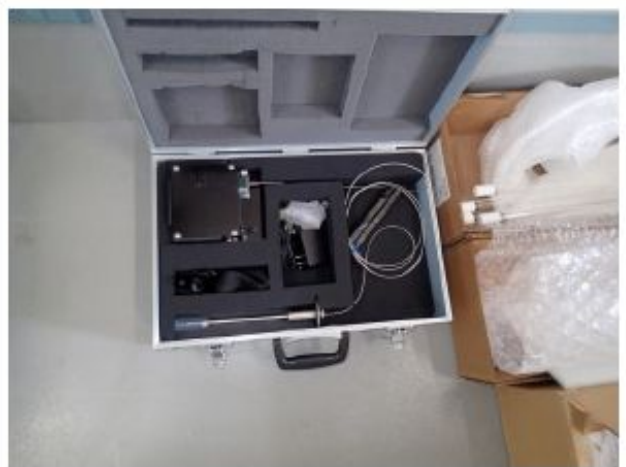
基準紫外線強度計