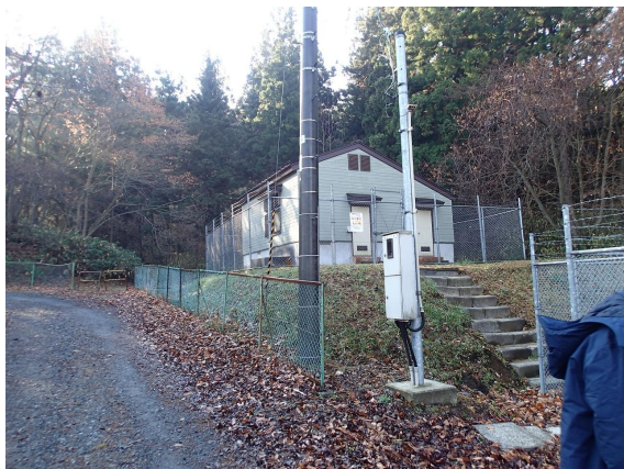
K n 調整井