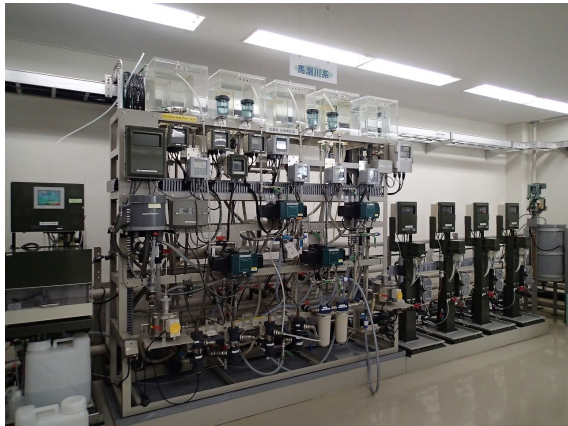
水質計器室 ( M b 川系 )