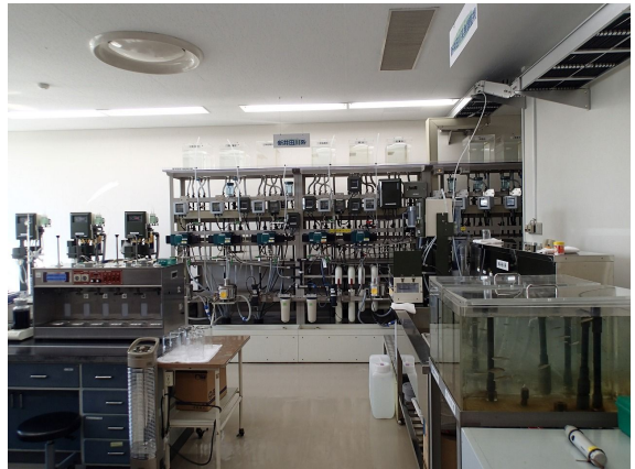
水質計器室 ( A r 川系 )