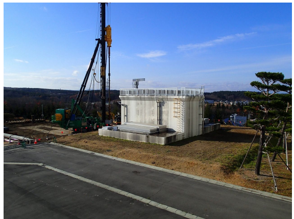
着水井と粉末活性炭接触池 ( 建設中 )