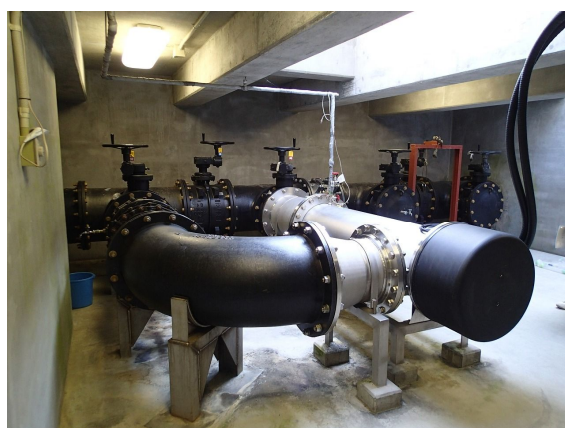
紫外線照射装置1 (シルバー)