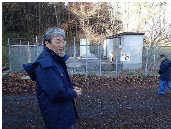
紫外線装置室 (地下構造)