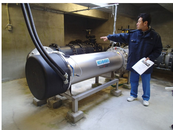
紫外線照射装置2 (シルバー)