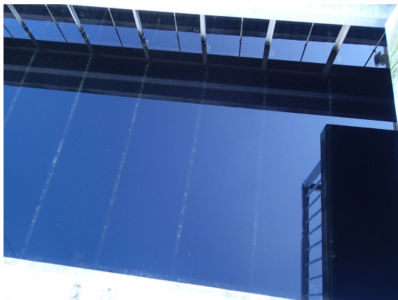
沈澱池 ( 凍結防止用エア-管 )