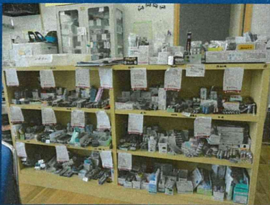
南三陸町入谷小学校保健室の仮設医療室の薬品棚

今後はベーシックなものからスペシャリティなもの(総務・通信・広報・調達・資金等)へ検討したり、今後の災害医療対応の在り方を踏まえた研修内容の議論が今後必要である。