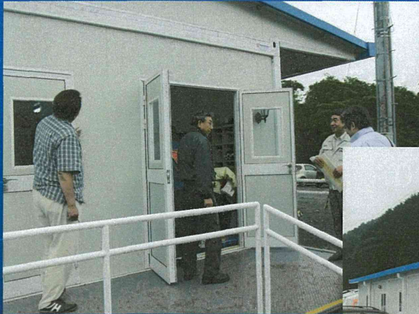
6.27引き渡し式 当日 入り口付近の様子