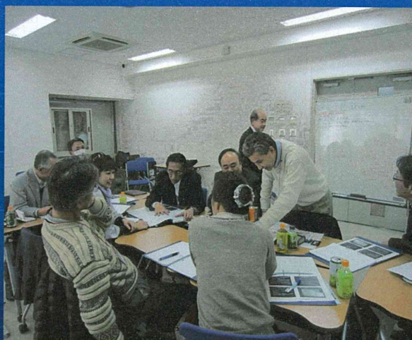
ロジ協主催セミナー 派遣シミュレーション

日本災害医療ロジステック協会(ロジ協)が主催し第2回目のロジスティクスセミナーを実施した。これをアンケートなどから今後の研修の在り方を評価・検討する。