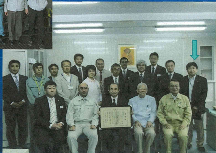
建設した岩手県立大槌病院仮設診療所 関係者の皆さん