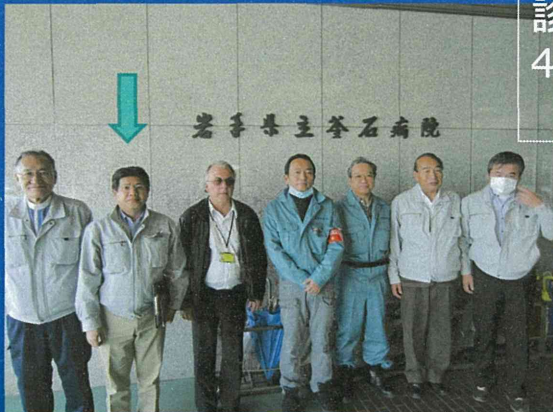
診療所建設のための2次調査 4.15岩手県立釜石病院 聞き取り調査・確認ほか