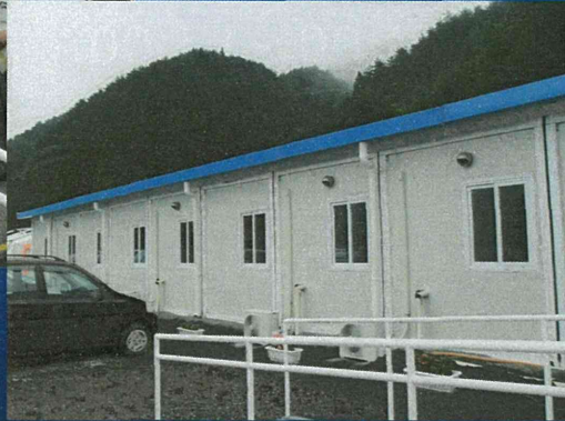
6.27引き渡し式 当日 建物の一部の様子