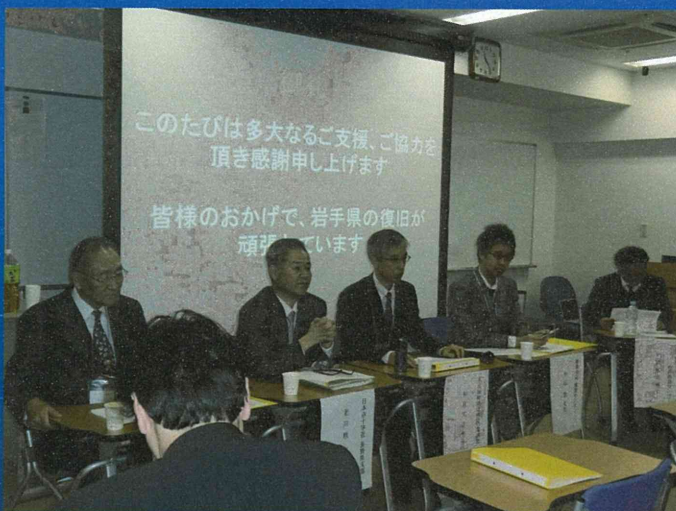
中級研修 パネルディスカッション 課題検討