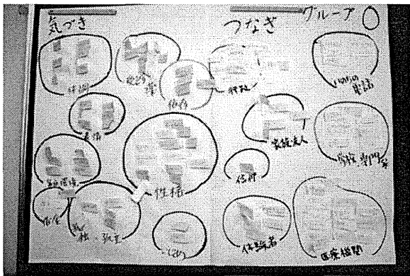
壁に掲示された成果物

いただきました。午前中の講義や劇団 toro による寸劇で学んだ患者とのやり取り（関わり）、模造紙にまとめた「気づきとつながり」のグループワークを踏まえて、グループごとにオリジナルのシナリオ作成を行いました。日常業務での経験も入れ込みながら、どのグループも真剣に取り組んでいただいたようです。最後には作成されたシナリオを使った寸劇を発表し、どの会場も盛り上がりました。