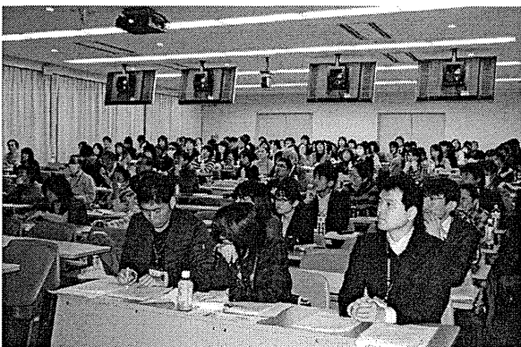
講義を聞く参加者の様子

患者との信頼関係が最も重要とはいえ、一人の薬剤師ができる支援には限界があり、自殺リスクの高い患者を薬剤師一人が抱え込むことは、患者・薬剤師の双方にとって危険です。そこで、適切な支援への「つなぎ」が重要となります。処方医への「つなぎ」や、精神保健福祉センターなど地域のメンタルヘルス支援資源への「つなぎ」の重