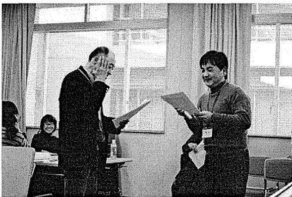
オリジナルシナリオによる寸劇の様子

いただきました。午前中の講義や劇団 toro による寸劇で学んだ患者とのやり取り（関わり）、模造紙にまとめた「気づきとつながり」のグループワークを踏まえて、グループごとにオリジナルのシナリオ作成を行いました。日常業務での経験も入れ込みながら、どのグループも真剣に取り組んでいただいたようです。最後には作成されたシナリオを使った寸劇を発表し、どの会場も盛り上がりました。