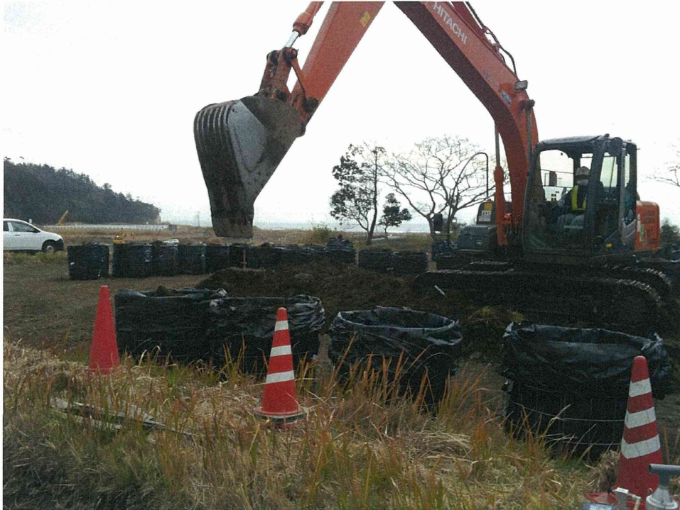
写真1 重機によって汚染土壌がフレコンバックに回収される