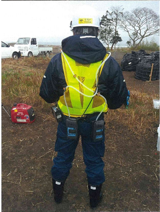
写真 3・4.個人ばく露測定 of 装備 (研究員)