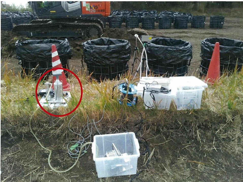
写真2 定点における粉じん計測（赤丸はアンダーセンサンプラー）