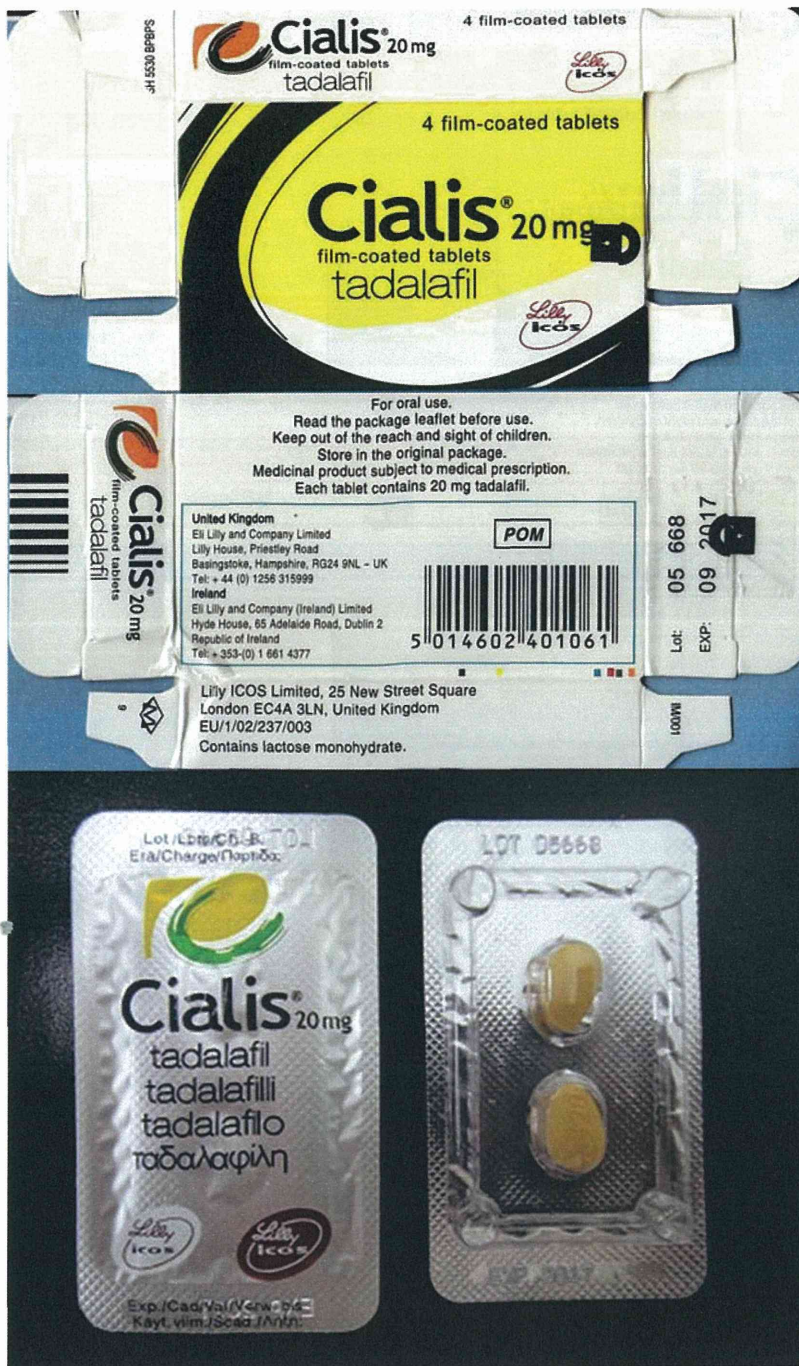
図 5-4. ボックスタイプの製品:ボックスタイプ 4 (17-20-B4-CN-8-5: 模造品)