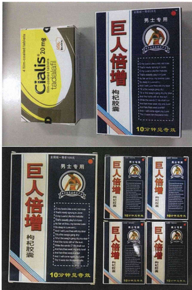
図 6. 異なる製品の箱に入っていたボックスタイプのシアリス (17-20-B3-CN-8-4 : 模造品)