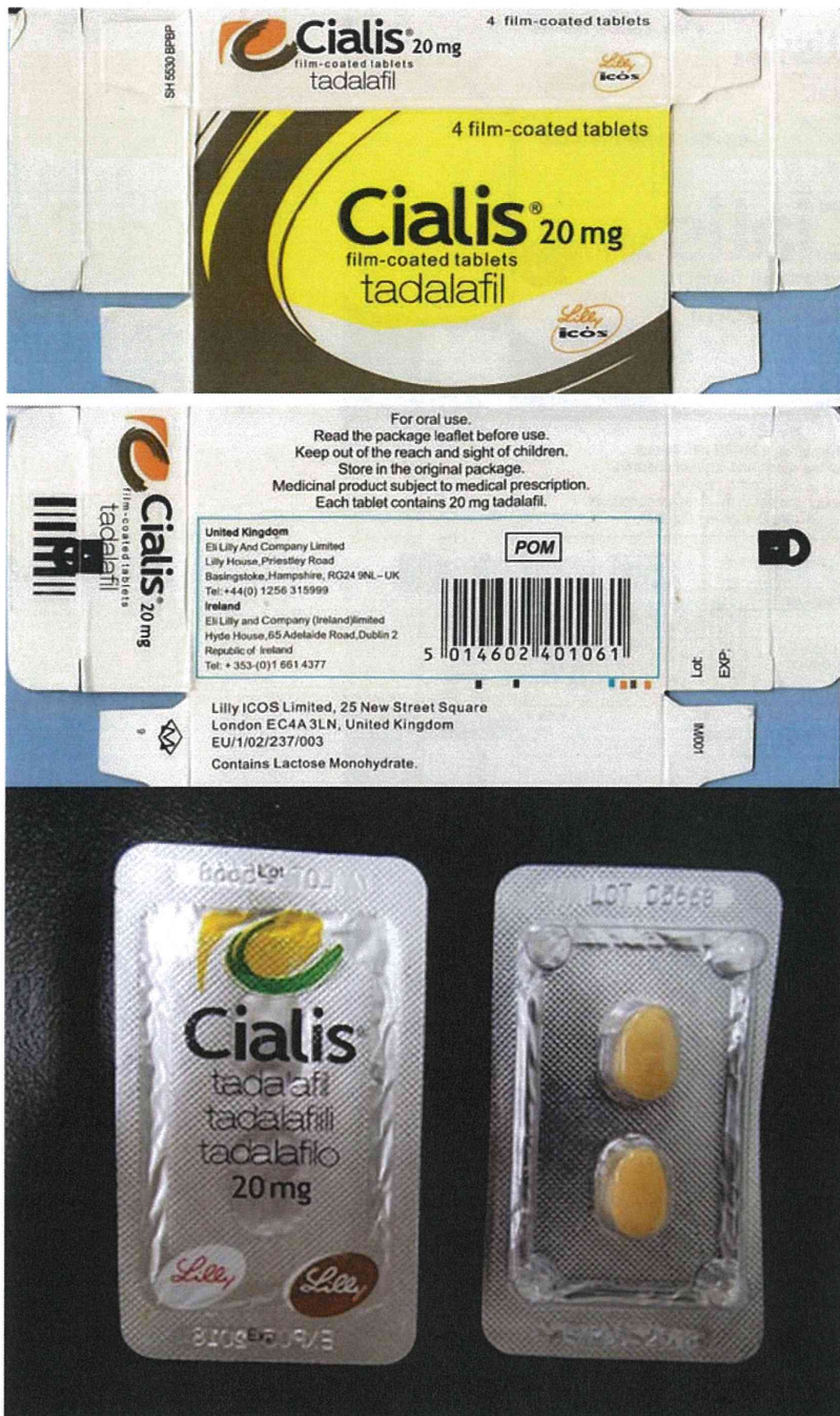
図 5-3. ボックスタイプの製品:ボックスタイプ 3 (17-20-B3-CN-8-4 : 模造品)