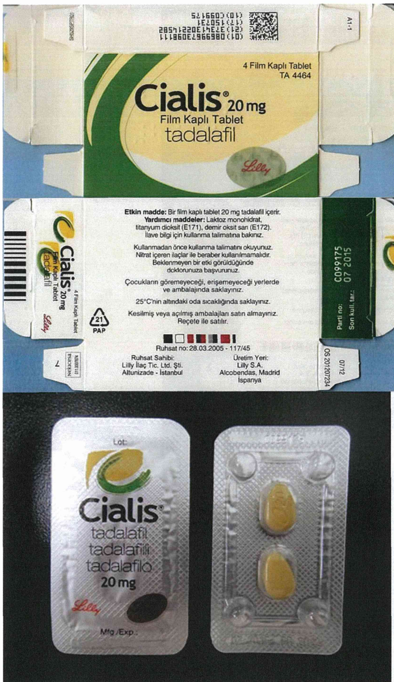
図 5-1. ボックスタイプの製品 : ボックスタイプ 1 (06-20-B1-SG-32 : 真正品)