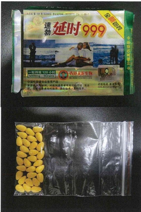
图 3. バラで届いた製品 (14-20-D1-CN-30 : 真正性不明)