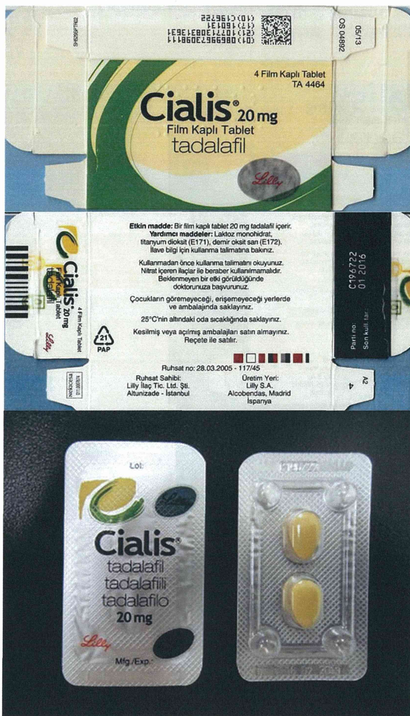
図 5-2. ボックスタイプの製品：ボックスタイプ 2 (11-20-B2-SG-28 : 真正品)