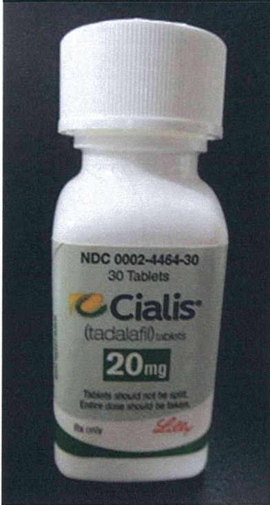
図 7-1. ボトルタイプ 1 のシアリス (11-20-C1-USA-30 : 真正品)