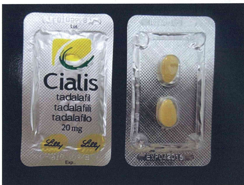
図 4-2. PTP シートのみで届いた製品：PTP シートタイプ 2 (04-20-A2-HK-36：模造品)