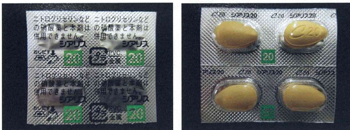
図 4-1. PTP シートのみで届いた製品：PTP シートタイプ 1 (25-20-A1-SG-4：真正性不明)