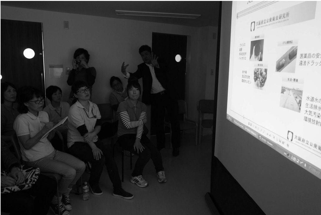
図 4-1. 施設訪問 講習型