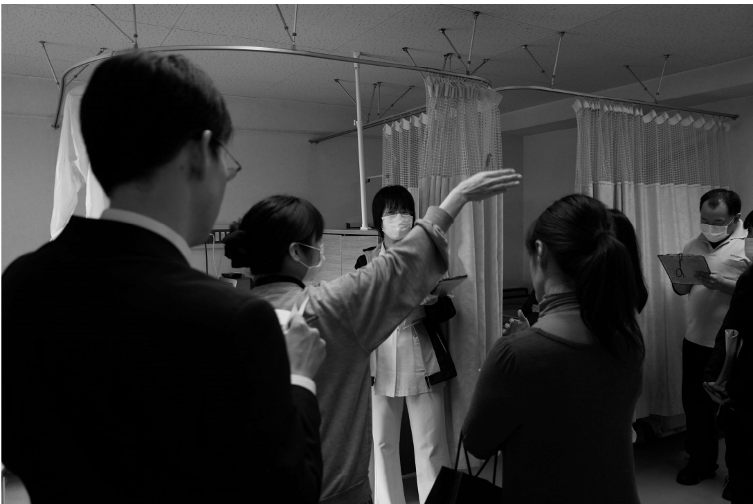
図 4-2. 施設訪問 感染症対策調査型